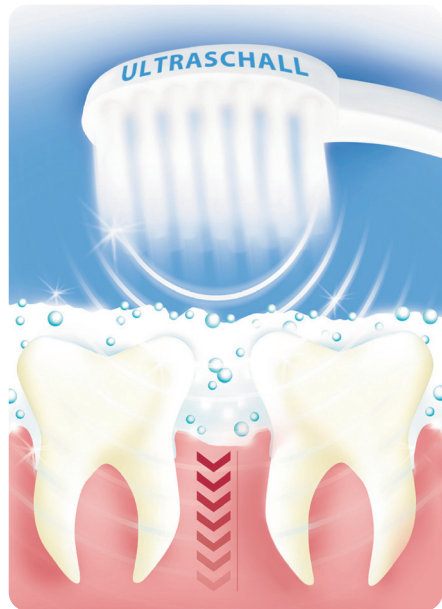
Die emmi®-pet reinigt selbst dort, wo Borsten nicht hinkommen. Der Ultraschall reduziert Bakterien auf und tief im Zahnfleisch.

in die Ultraschallzahncreme übertragen. In der mitgelieferten emmi®-pet Ultraschallzahncreme befinden sich mikroskopisch kleine Luftbläschen (Mikrobläschen), die ein zusätzliches Produktionsschritt angereichert wurden. Hierzu liegt von der Goethe Universität Frankfurt am Main eine entsprechende Bestätigung vor. In einem Bereich von einem \text{mm}^3 wurden mehr als 3,5 Mio. Mikrobläschen nachgewiesen. Die Ultraschallschwingungen zerstören die Struktur der Mikrobläschen und diese fallen in sich zusammen. Dabei entsteht ein Sog-Effekt, der den Biofilm und die Beläge von den Zähnen löst. Im Nachgang empfehlen wir mit den Borsten über die Zähne zu gehen, um den gelösten Biofilm sowie die Beläge vom Zahn abzutragen. Dies alles geschieht, ohne dass Ihr Tier etwas davon